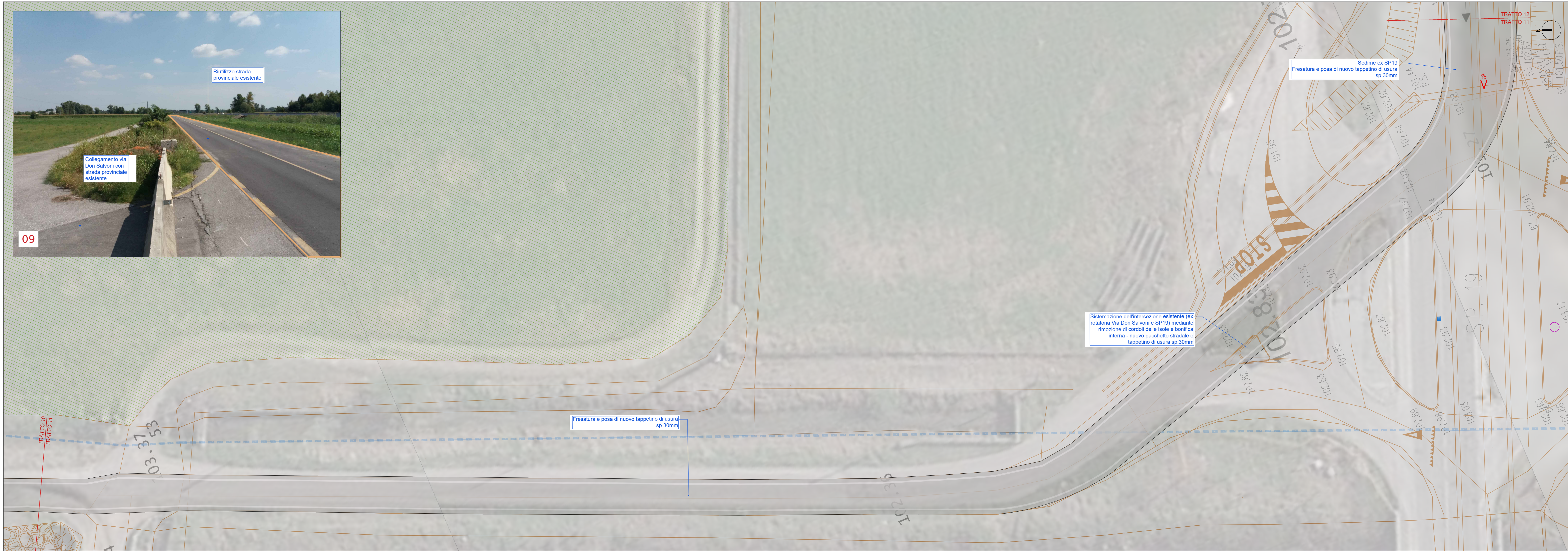
Tratto 11 scala 1:200