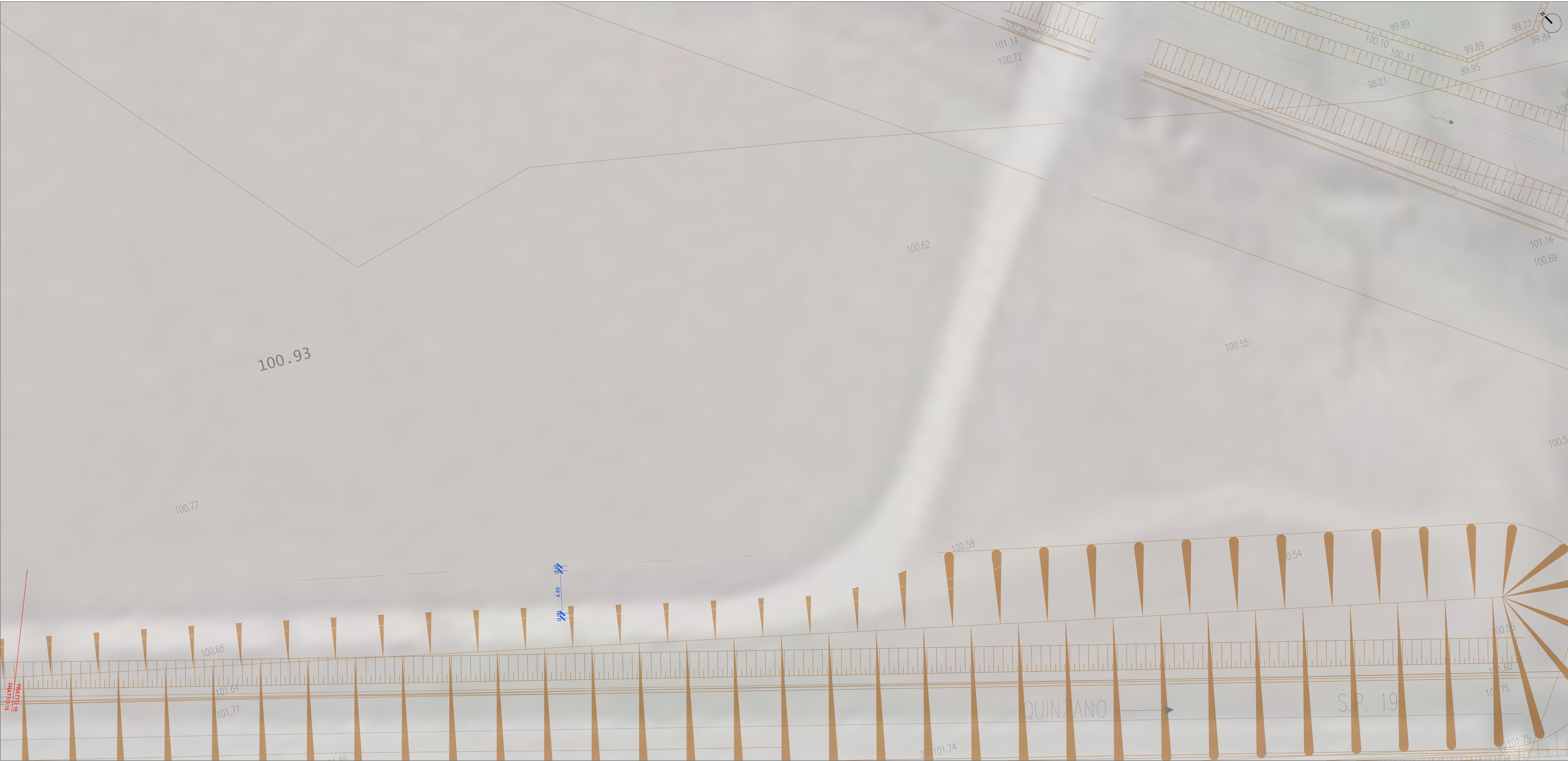
Tratto 16 scala 1:200